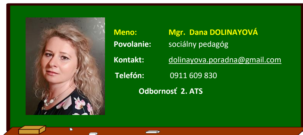
Organizačná štruktúra CPP KNM od 1.1.2023